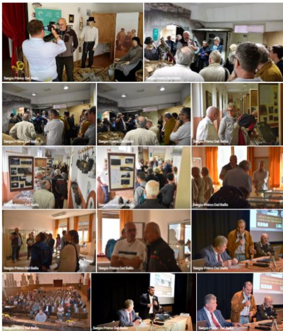
Conferimento del premio del concorso ITM Basilio Mosca 2016 al Biodistretto Valle Camonica